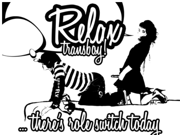
Nac: On el gènere perd el seu nom